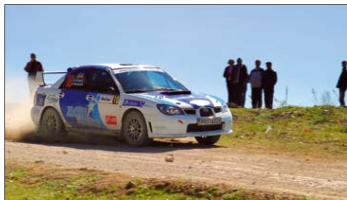
Третье место на подиуме стало отличным подарком к 23-летию Юрия Протасова.